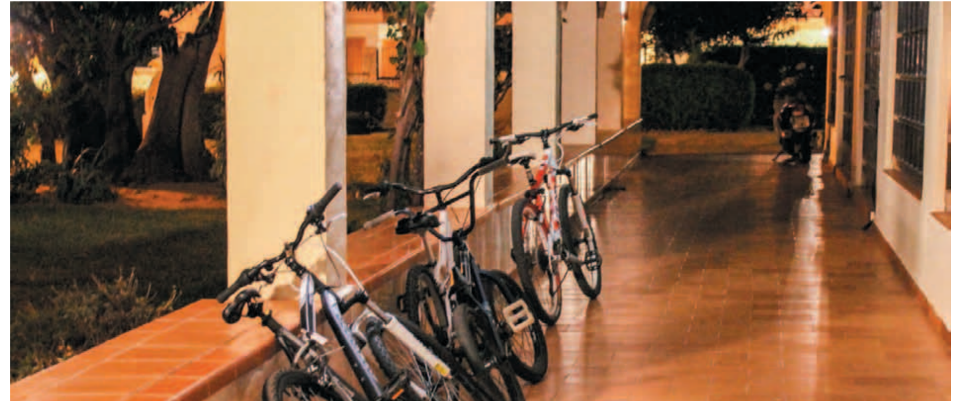
Pacosintuvan edusta lauantai-iltana.

Pacosintuvan osoite on Edf. El Condor, Avda Los Pacos.