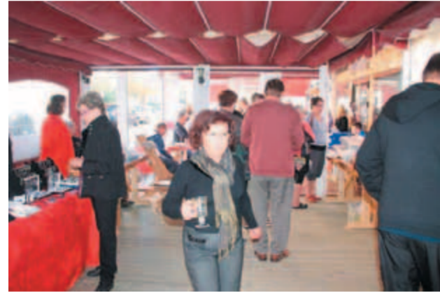
Centro Finlandian itäinen seinusta aukeni markkinakaduksi.

Markkinat toteutettiin ensimmäistä kertaa kokonaan katetulla Centron itäisellä seinustalla. Se osoittautui oivaksi paikaksi järjestää isojakin tilaisuuksia. Edes sade tai tuuli eivät juhlaadulla tunnelmaa haitta.