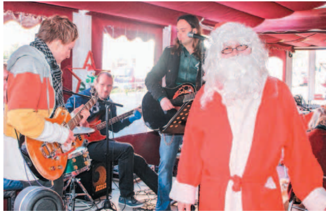
Joulumarkkinoiden juontajana toiminut Korvatunturin herra innostui Kameleontin musiikista.